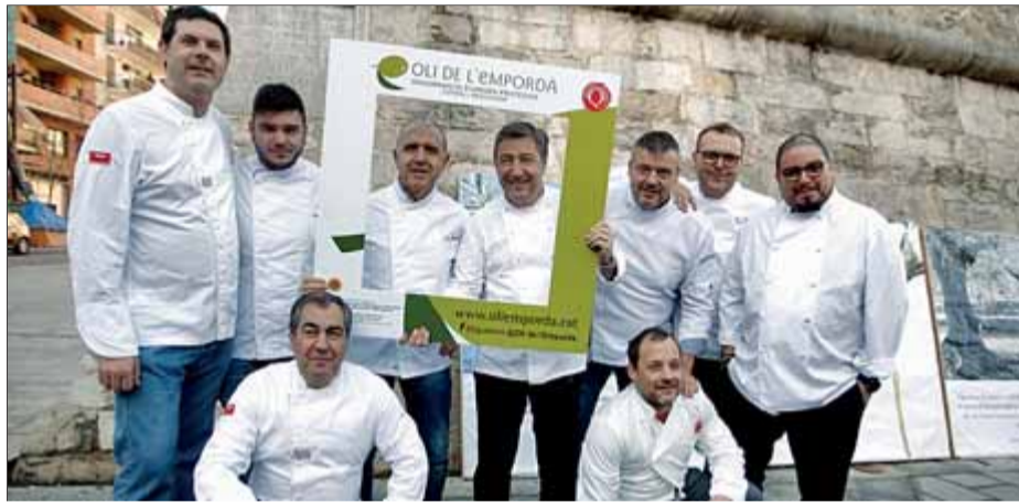
Girona Bons Fogons s'ha adherit a la campanya de la DOP Oli de l'Empordà